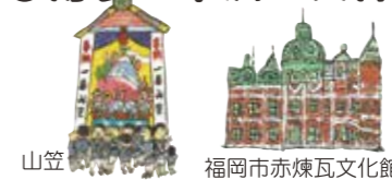
山笠 福岡市赤煉瓦文化館