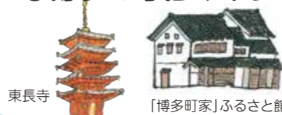
東長寺 「博多町家」ふるさと館