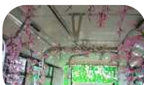
3 月 さくら

「ぐりーん」は年間を通して地域の季節・イベントに合わせた様々な車内装飾を行っており、ご利用いただいたお客さまに楽しんでいただける企画を実施しております。