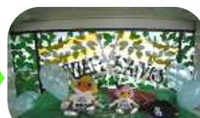
8 月 福岡ソフトバンクホークス