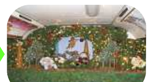
12 月 ライトアップ