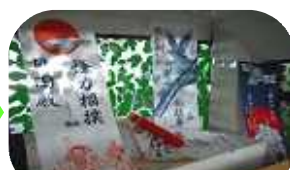
7 月 山笠