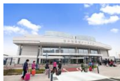
博多港国際ターミナル