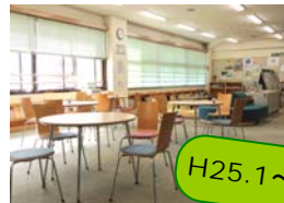
NPO・ボランティア 交流センターあずみん