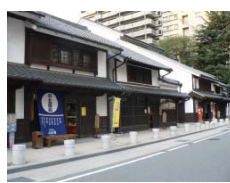
「博多町家」ふるさと館