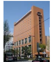
サットンホテル 博多シティ