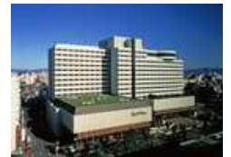
ホテル ニューオータニ博多

このように、福岡市は民間と共働でFukuoka City Wi-Fiを拡大し、都市の魅力・都市間競争力の向上を目指します。