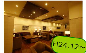
サットンホテル博多シティ