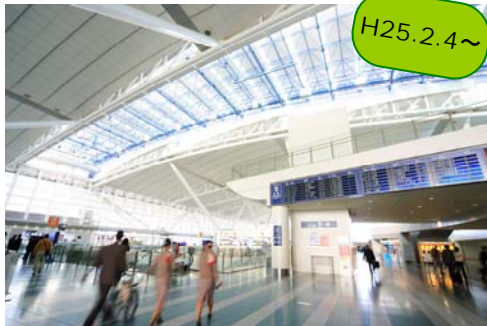
福岡空港 国際線ターミナル ※国内線ターミナルは既にサービス中