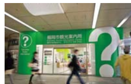
観光案内所(天神、博多)