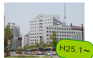
福岡ソフトリサーチ パークセンタービル