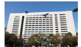
福岡市役所(ロビー、西広場)