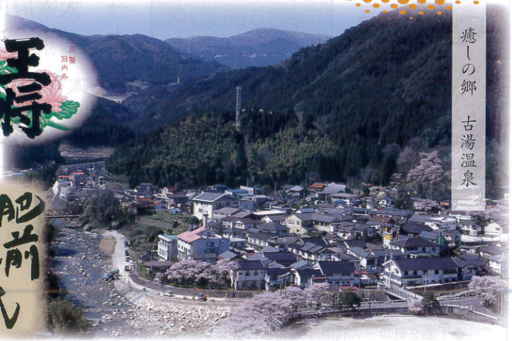
癒しの郷 古湯温泉

扇屋 歌人「斎藤茂吉」も静養したマイナスイオンたっぷりの静かな嘉瀬川沿いの旅館です。