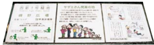
サザエさん記念碑