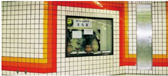
藤崎遺跡展示コーナー(地下鉄藤崎駅構内)