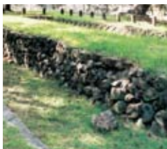
元寇防塁跡 (西南学院大学体育館南)