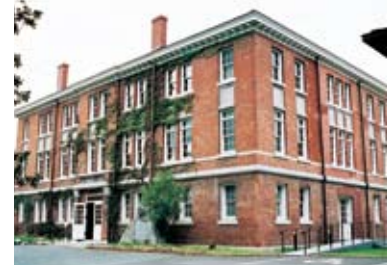
西南学院大学博物館