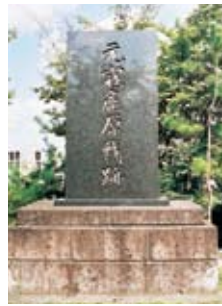
元寇の碑(祖原公園)