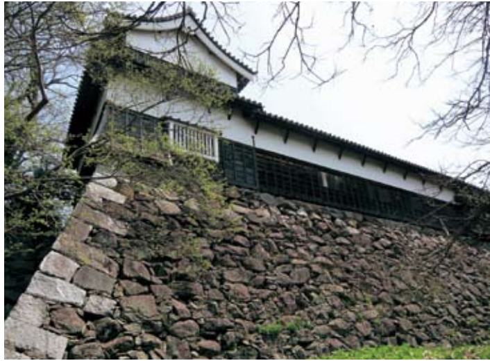
福岡城跡(南丸多間櫓)