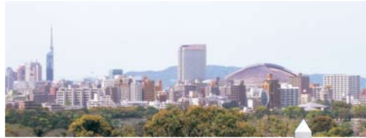
天守台から西方面の眺め