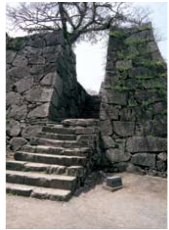
天守台上り口・鉄(くろがね)御門跡