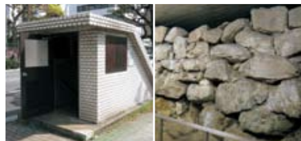
福岡城跡堀石垣入口(明治通り)