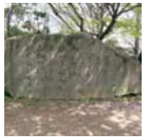
筑紫の館万葉歌碑