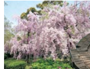
舞鶴公園の枝垂桜