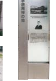
西南学院発祥の地