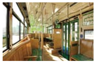
木材をふんだんに使用した快適な車内