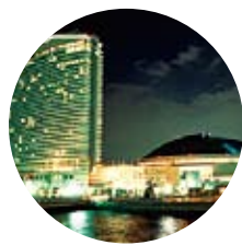
シーホーク・ヤフドーム