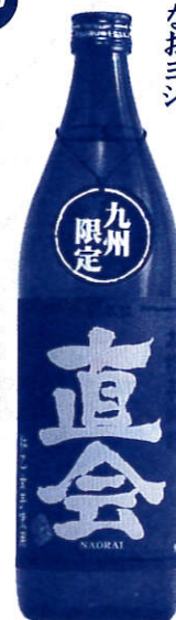
本格芋焼酎 紅乙女 直会 25度