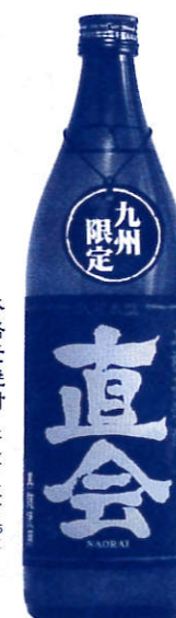
本格麦焼酎 紅乙女 直会 25度