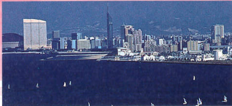
시사이드 모모치 해변 (후쿠오카타워/야후 돔)