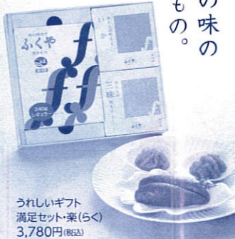
うれしいギフト 満足セット・案(5らく) 3,780円(税込)