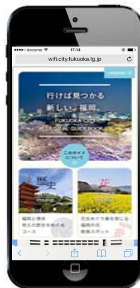
Wi-Fiを活用した観光プロモーション

NTTBP：プロモーションコンテンツ配信、臨時Wi-Fiスポット整備 データ分析および結果報告書の作成