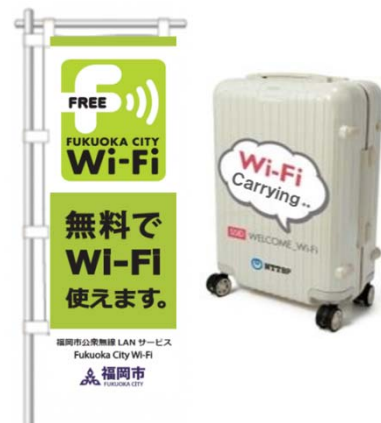
臨時Wi-Fiスポットを4か所に設置