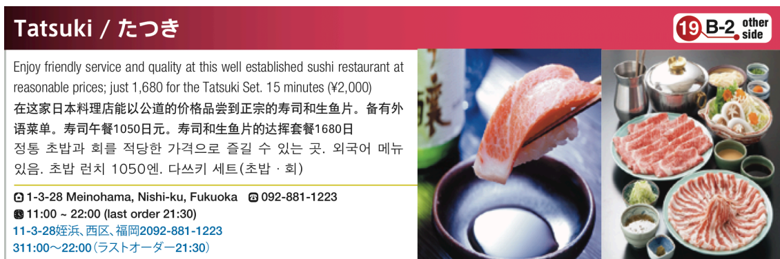
写真1点、3か国語使用の場合 (実際のサイズ115mm×37.5mm ※ダブルサイズは115mm×75mm)

通常枠1/6P ¥95,000のところを1/5Pの大きいサイズで定価 ¥95,000