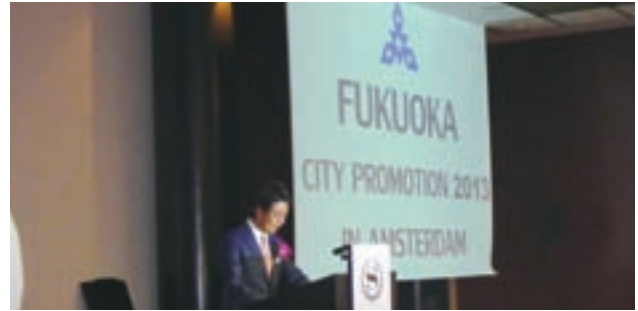
高島市長によるプレゼン

に加盟したICCA（国際会議協会）の本部（アムステルダム）を訪問。欧州のユニークなコンベンション会場の視察なども含めた今回の経験を踏まえ、今後も福岡市と共に継続的な欧州へ向けた誘致・プロモーション活動に取り組んでいきます。