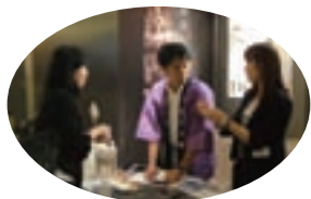
商談会での福岡市のブース