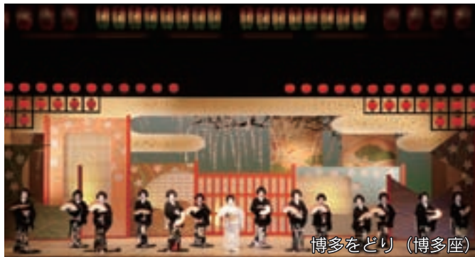
博多をどり (博多座)