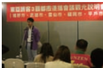
福岡市の魅力を最大限PR

このようなことから、ビューローでは、今後も台湾での誘致・プロモーション活動を積極的に実施していく予定です。