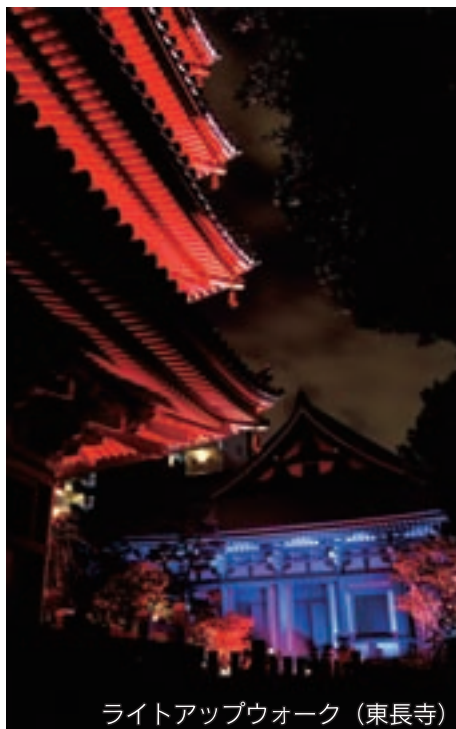
ライトアップウォーク (東長寺)