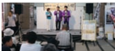
ライオン広場での「軍師官兵衛」福岡プロジェクト協議会と連携したPR

「軍師官兵衛」の放映を福岡への観光客増加に結びつけるために、様々なプロモーション活動も行っています。『「軍師官兵衛」福岡プロジェクト協議会』への参加及び協議会と連携したPRや、他都市でのプロモーション、ビューローが発行する媒体やウェブ上での情報発信、メディアからの取材対応などを積極的に行っています。