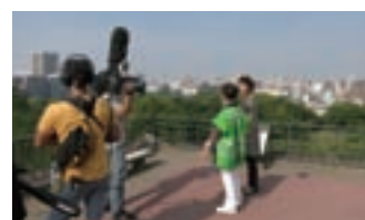
黒田家ゆかりの地まち歩きの取材風景