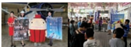
名古屋市でのプロモーション(新聞社訪問)