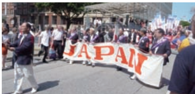
ハンブルク大会のパレード①

「2016年ライオンズクラブ国際大会」の福岡開催が決定していますが、福岡大会は、国内外から約3万5千人の参加が見込まれる国際大会であり、期間中、参加者による趣向を凝らしたパレード、約2万人が参加する開会式や総会、国際ショーなど、盛りだくさんの行事が予定されています。