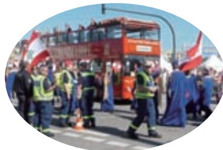
ハンブルク大会のパレード②

コンベンション関係者のみならず、福岡市をあげて歓迎やおもてなしを行い、参加者にとって強く印象に残る大会にすることで、世界に向けて福岡のPRや様々なコンベンション・観光客の誘致につなげていく絶好の機会にしたいと考えています。