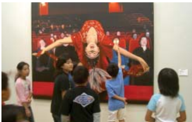
2005年の第3回トリエンナーレのひとつ

そして、この秋に開催される開館10周年記念展「第4回福岡トリエンナーレ」(会期:9月5日～11月23日)では、この二つの特徴が大規模な形でミックスされます。アジアの現代アートが一堂に集まるだけでなく、注目のアーティストたちが多数来福し、美術館内外で多彩な美術交流を展開していきます。アジア美術のこれからの10年を占う展覧会として、またアジアを体感できる絶好の機会として、ぜひ多くの皆さまに来館していただきたいと思ひます。