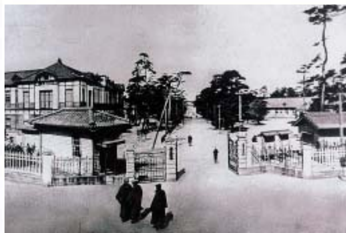
設立当時の福岡医科大学。写真左の門衛所は昔のままのものが残っている。