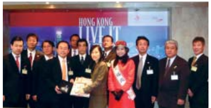
ミス福岡も参加して福岡をPR

また、日本香港観光交流年である今年は、香港からアジアマンスへの参加も予定されており、交流を深めながら、福岡をアピールしていくことにしています。