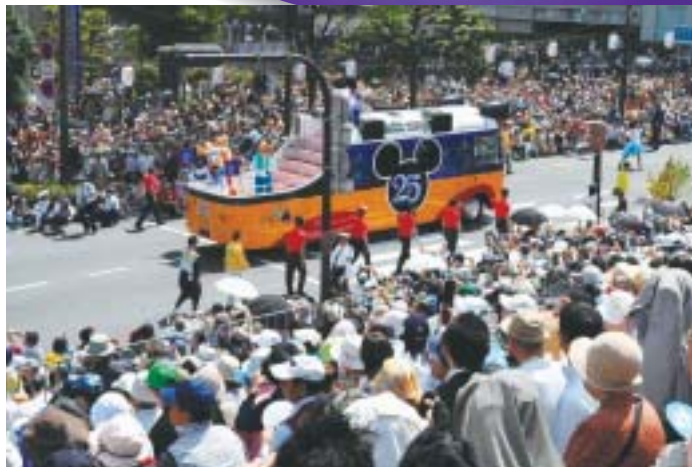
観光栈敷席から見た昨年のパレードのようす