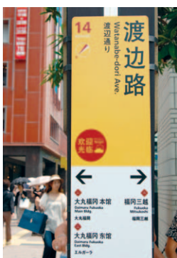
クルーズ客船寄港日には、中国語と英語表記の道路案内板を設置

クルーズ客船はいわば「移動するホテル」。船内にいくつものレストランやバー、プールや劇場、カジノなどがあり、ゆったりとした時間を楽しめます。各寄港地では、ほとんどの乗客が下船して、その土地の魅力を味わいます。福岡でも、通常朝(午前中)に博多港に着岸し、夕方(夜)に出港するという半日の滞在となります(※)。(※船により寄港時間などは異なります。)