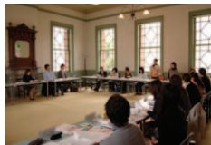
赤煉瓦文化館にて

来年の九州新幹線全線開通を前に、観光客の受け入れ環境整備の一環として開催。福岡市と近郊の市町村の観光案内所などで情報の共有をするなどの連携、提供する情報や接遇のレベルアップ、問題点の改善などを目標に掲げています。また、各案内所スタッフの顔と名前を覚え、勉強会や意見交換会の場としていくとともに、メンバー全体で観光等の魅力を発信し、来訪者に安心感と、心から旅を楽しめる情報を提供する「おもてなし」の向上を目指します。