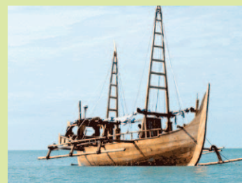
スピリット・マジヤパヒト号