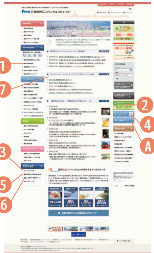
韓国版ホームページ