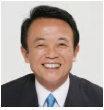
社団法人 日本空手協会 九州地区本部 会長 麻生 太郎 (衆議院議員)

しかもそれは、皆様にとって大きな財産となり自らの責任において人生を切り拓く力となることでしよう。本大会は伝統と歴史がある大会です。全国の仲間たちとの交流を深められ、心に残る素晴らしい大会にしてください。最後に、福岡での開催にご尽力いただきました社団法人日本空手協会をはじめ関係各位に敬意を表しますとともに、一層のご活動、ご発展を祈念します。