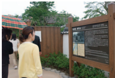
修復された 坂本繁二郎の 生家で

第二回観光案内所ネットワークミーティングでは坂本繁二郎生家を見学しました。JR久留米駅より徒歩約5分という好アクセスの観光施設。実際に観光施設を見ることで、お客様に細やかなご案内が出来ますね！