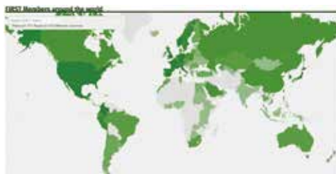
2024年3月現在の国別FIRST加盟組織数のマップ

FIRSTには、大学内に設置され学生や職員向けにサービスを提供するCSIRT、政府組織内のCSIRT、自社製品のセキュリティ関連情報の分析と公開を行っているCSIRTなど多様な形態のチームが集まっている。