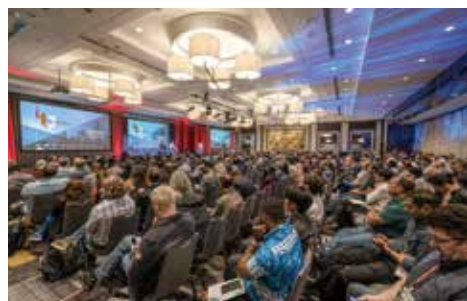
昨年のカンファレンス基調講演の様