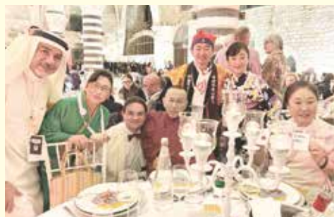
福岡に決定した時の様子

2026年の開催に向けて、観光地福岡の魅力をさらに磨き上げ、世界に福岡を発信する好機として、地域の皆様と一緒に取り組んでいきます。ご協力をお願いします。