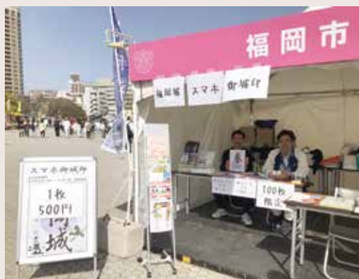
◀「福岡城スマホ御城印」(イメージ)